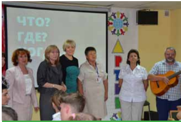
Педагоги исполняют Гимн Артековской школы