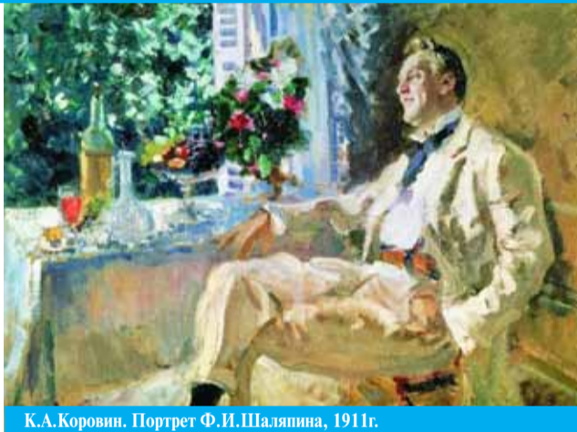
К.А.Коровин. Портрет Ф.И.Шаляпина, 1911г.