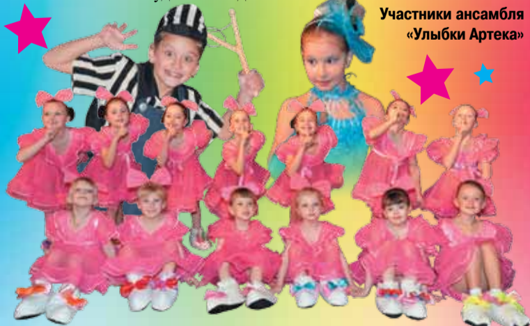
Участники ансамбля «Улыбки Артека»

Наша жизнь в коллективе – это не только концерты и репетиции, но и экскурсии, походы, совместные праздники. Время занятий в ансамбле мы не забудем никогда.